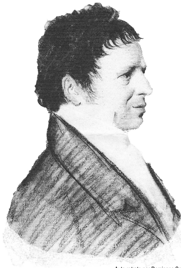
Auto-retrato por Domingos Sequeira